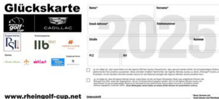
Rheingolf Cup Glückskarte 2025